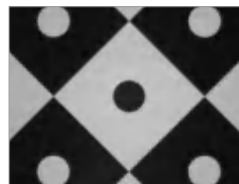
普通变倍镜头5X-棋盘格