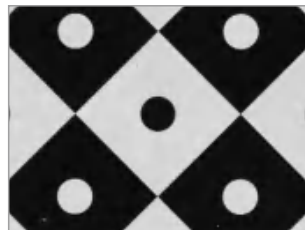
4k高分辨率变倍镜头5X-棋盘格